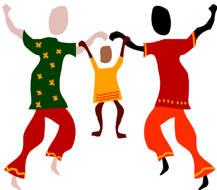
منشورة بمعرفة إدارة دعم الطلاب الخدمات مكتب الخدمات الشخصية للتلاميذ