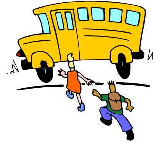
كيف يمكن لطفلي الذهاب إلى المدرسة؟

ستوفر المدارس العامة في مقاطعة بلنيمور وسيلة الانتقال للأطفال والشباب المشردين ممن يختارون الذهاب إلى المدرسة الموجودة في مسقط رأسهم، أو إلى المدرسة الموجودة في الحي الذي يعيشون به، وذلك إذا لم تكن المدرسة موجودة في نطاق يسمح لهم بالذهاب إليها سيراً على الأقدام.